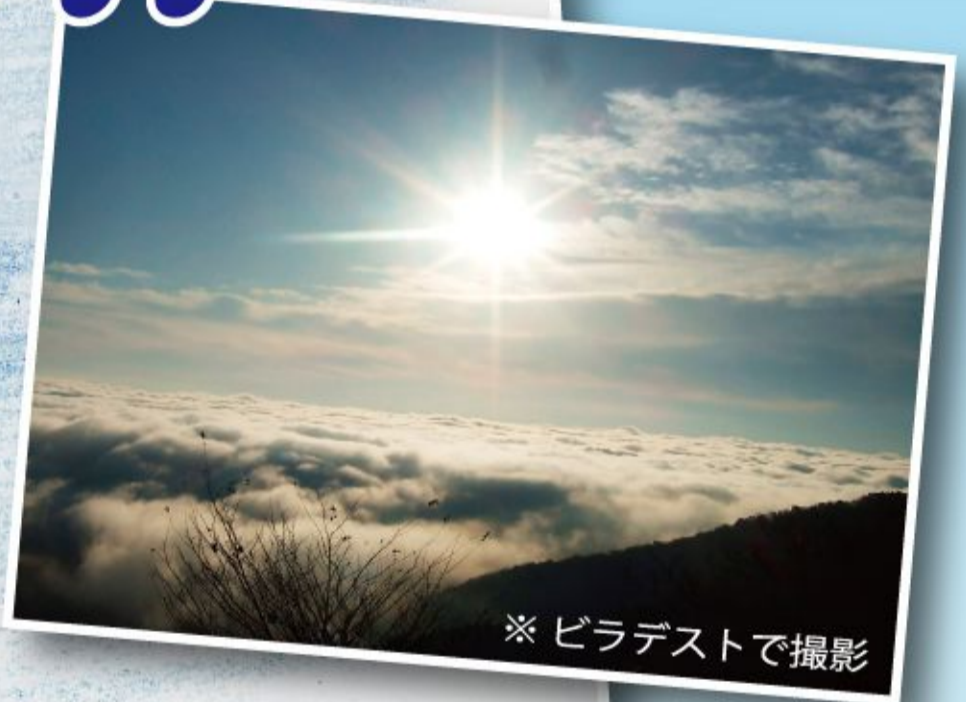
※ ビラデストで撮影